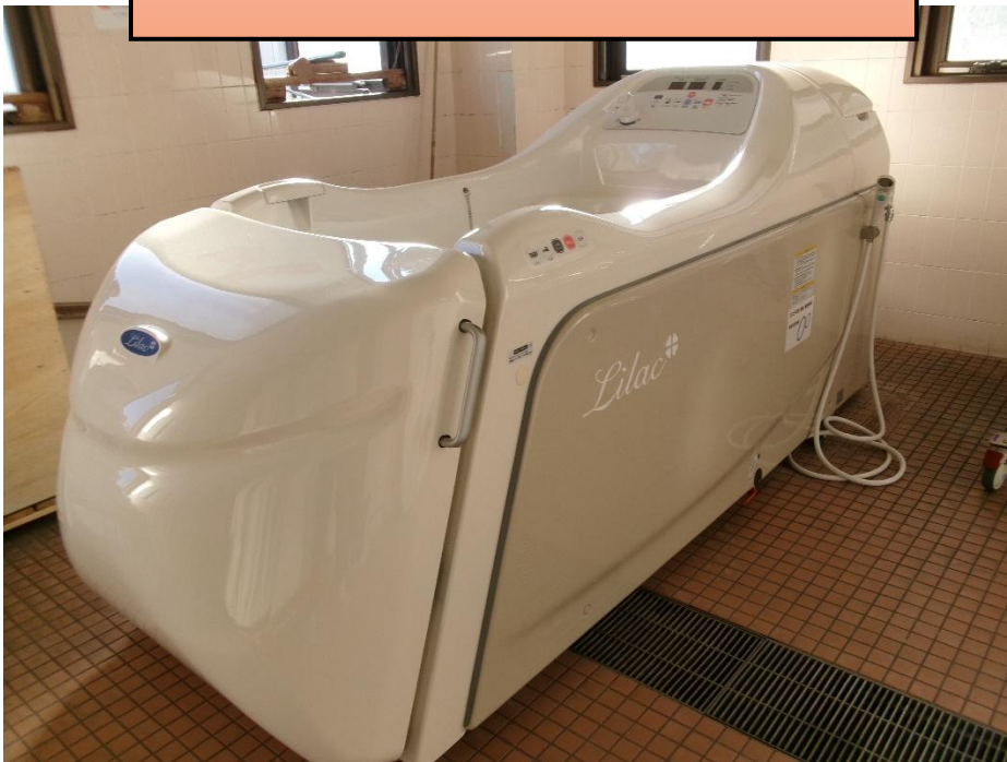
特殊入浴装置 : 酒井医療ライラックプラス